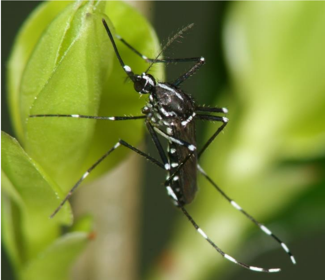
Asiatische Tigermücke