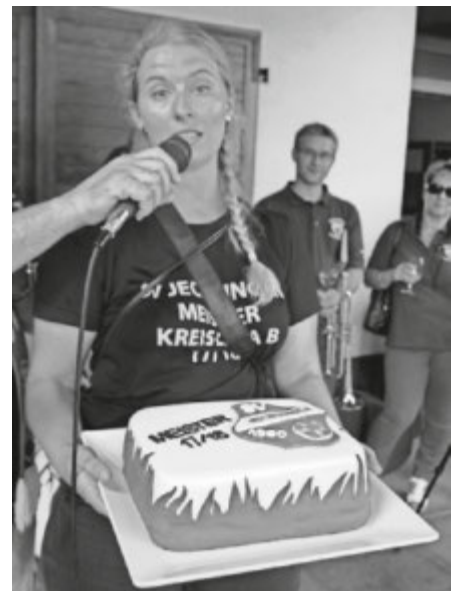
Von der Damenmannschaft gab es eine Torte zum Meister