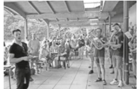
Badner Lied im Waldstadion zum Aufstieg mit der Winzerkapelle und den Gästen