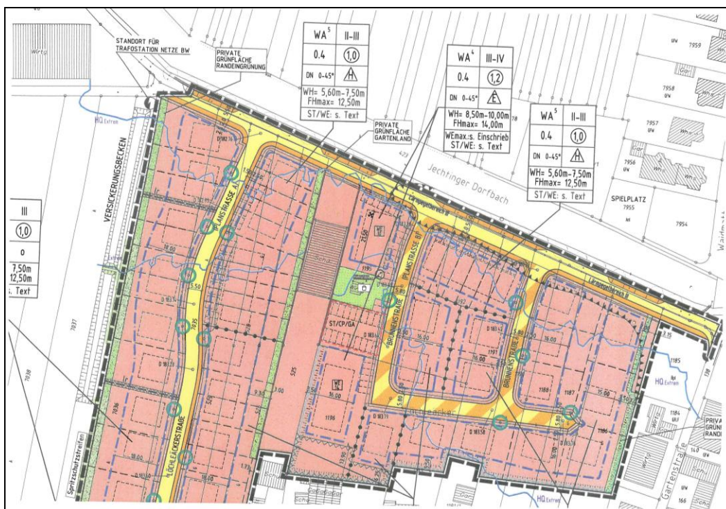
(Quelle: Planausschnitt i.d.F.v. 24.07.2019)

Da die Werte des § 17 BauNVO nur Orientierungswerte darstellen, und die Überschreitung dem in § 19 Abs. 4 genannten Wert von 0,8 entspricht, geht die Gemeinde zusammenfassend davon aus, dass mit der geänderten Festsetzungen keine nachteiligen Auswirkungen sowohl auf die Umwelt als auch auf gesunden Wohnverhältnisse verbunden sind.